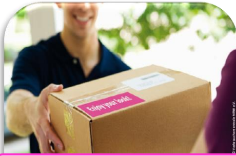
Foto: Adobe Stock/seanlockphotography, © Verbraucherzentrale NRW e.V.

1) Maria kauft eine Hose im Internet. Sie bekommt die Hose mit der Post.