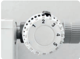
A Stufe 2