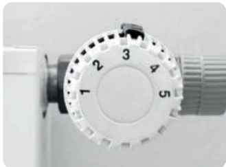
B Stufe 3