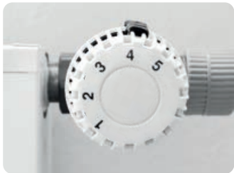
C Stufe 4