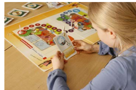
„Das Wettrennen mit Kohle, Gas und Öl“