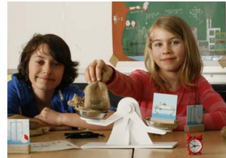
„Schwergewichte beim Duschen und Baden“

www.verbraucherzentrale.nrw/waermewissen