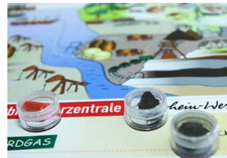
„Wie kommt die Wärme ins Haus?“