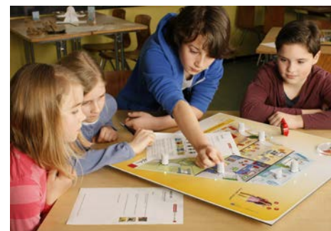
„Die Räder an denen ich drehe.“