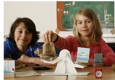
„Schwergewichte beim Duschen und Baden“

www.verbraucherzentrale.nrw/waermewissen