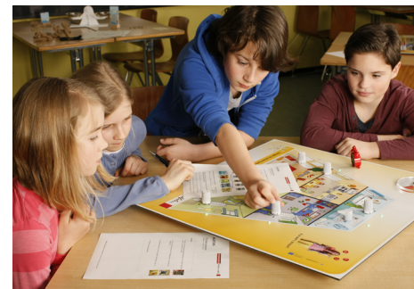
„Die Räder an denen ich drehe.“