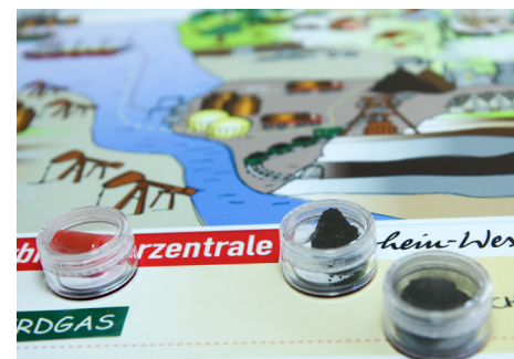
„Wie kommt die Wärme ins Haus?“