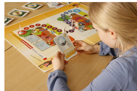
„Das Wettrennen mit Kohle, Gas und Öl“